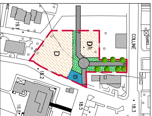
Estratto R.U. UTOE n° 2 - Comparto D